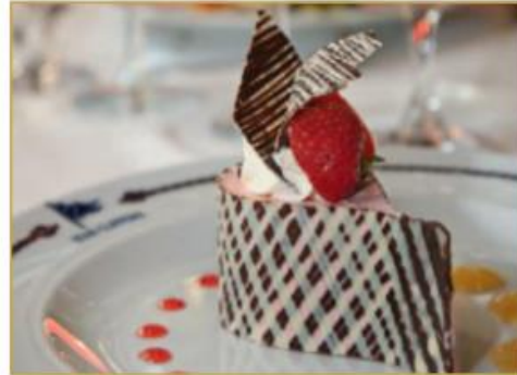
Suggestion de dessert (photo non contractuelle)