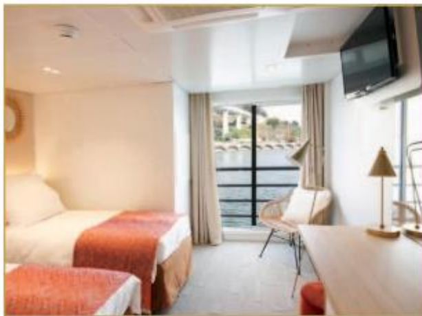
Cabine pont intermédiaire