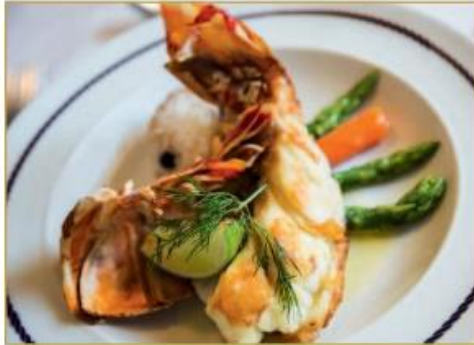
Suggestion de plat (photo non contractuelle)